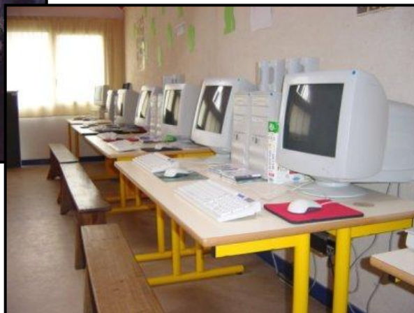
... et en 2003