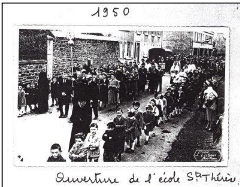
Ouverture de l'école S te Thérèse.

A cette époque il n'y a qu'une seule classe .