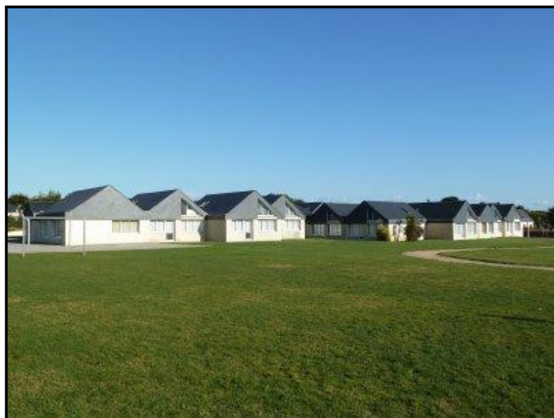
La forêt de toitures

La toiture de l'école est entièrement refaite fin août 2009 . Le coût de l'opération étant important (environ 240.000 euros), la remise en état aura été réalisée par tranche et aura duré 6 ans.