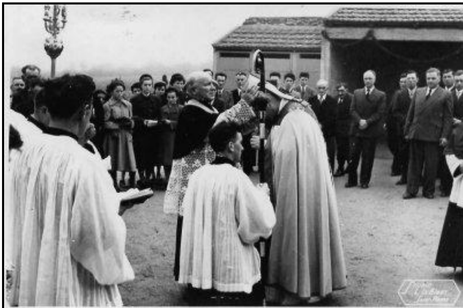
Cérémonie d'ouverture de l'école Sainte-Thérèse en 1950.

A cette époque il n'y a qu'une seule classe .