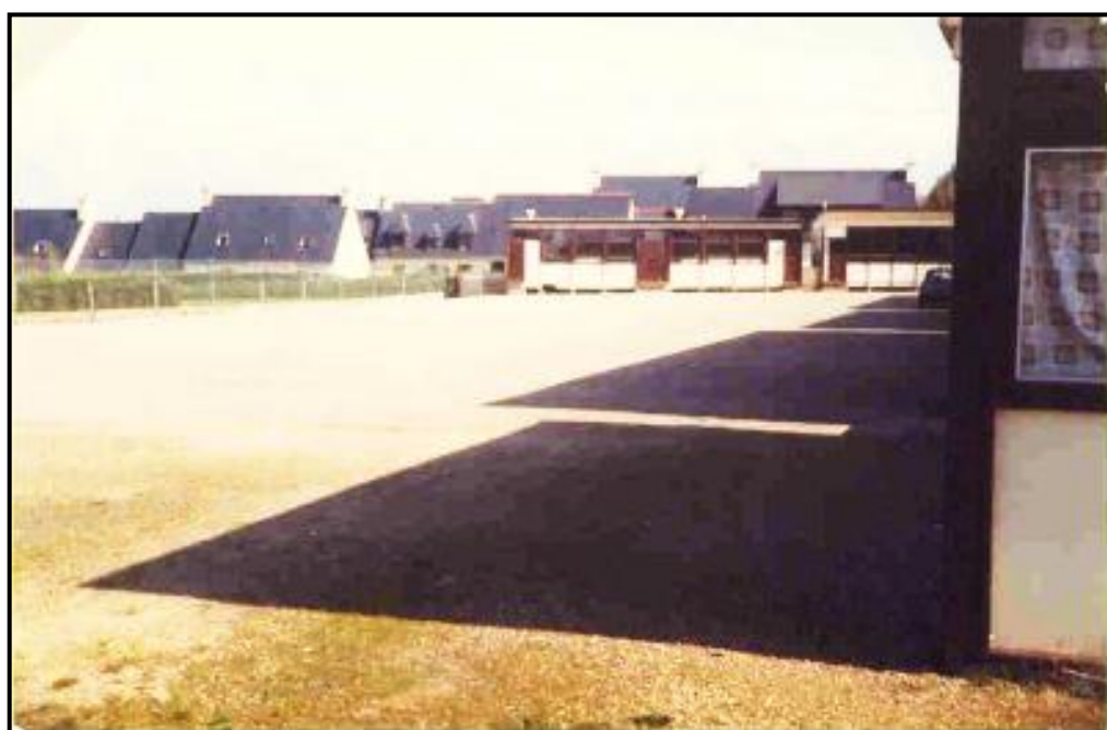
L'école primaire en 1986 .