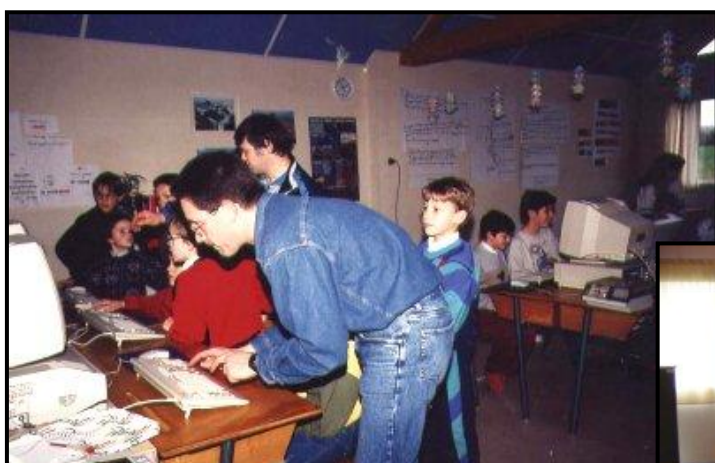
Salle informatique en 1994 ...